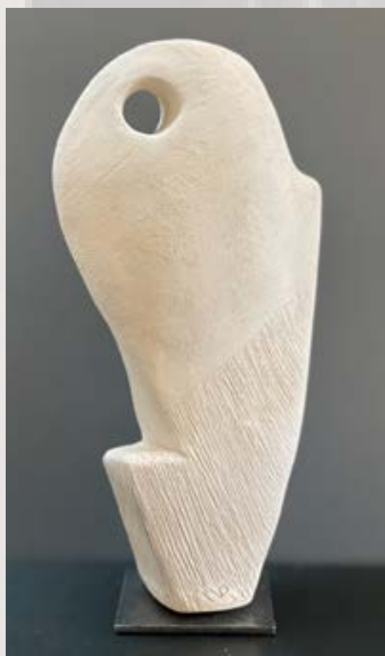
DOMINIQUE NOUVEAU | SCULPTURE